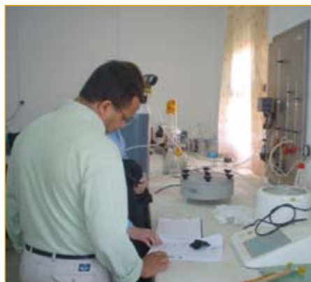
Laboratoire matériaux du CEMGI/LPEE.

C'est décidé, le LPEE organise des Journées Portes Ouvertes (JPO) en novembre. L'événement, qui fait encore l'objet de réunions de cadrage, aura précisément lieu lors de la 16 ème édition de la Semaine Nationale de la Qualité, prévue du 5 au 9 novembre sur tout le territoire national. Son objectif est clair : il s'agit de montrer aux participants à ce rendez-vous annuel de la qualité que le LPEE est à la fois un opérateur qualité de premier plan car toutes ses prestations quelles qu'elles soient sont rendues dans le respect strict des normes en vigueur dans ses différents domaines d'activité (Bâtiment, Industrie, Infrastructures, Environnement, Energie...); mais également un ardent défenseur de la qualité.