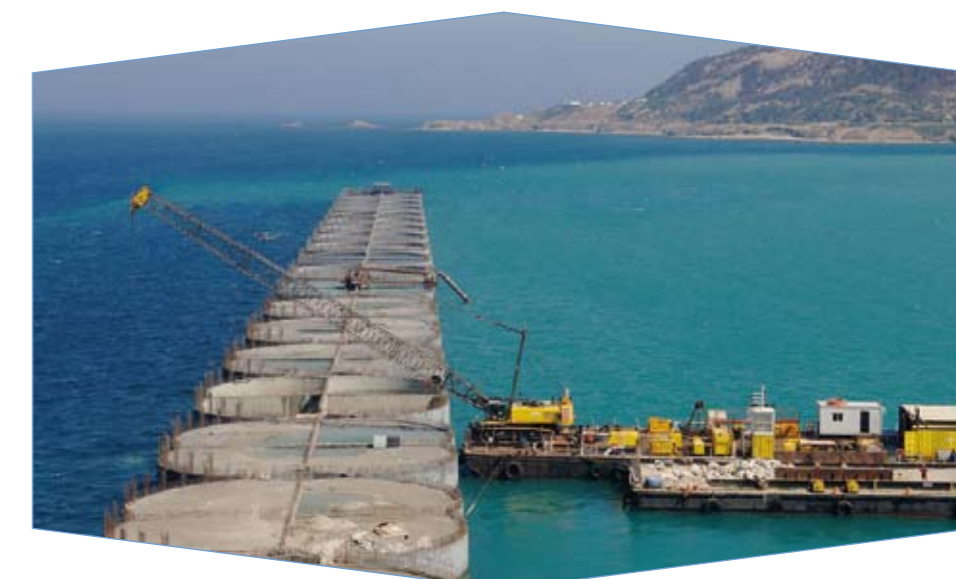
Port de Tanger.

Dans la pratique, rien n'assure que les phases d'identification des effets, de génération de stratégies, et d'évaluation des variantes existent de façon indépendante et surtout se déroulent dans l'ordre indiqué. D'où quelques difficultés limitant la validité des trois postulats de prise de décision.