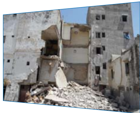
Ici, l'un des bâtiments effondré dans la médina de Casablanca.

Ouf ! Le Centre Scientifique et Technique des Constructions (CSTC) du LPEE a enfin remis son rapport de diagnostic des constructions menaçant ruine à la Wilaya du Grand Casablanca. Cela s'est passé le 17 septembre dernier.