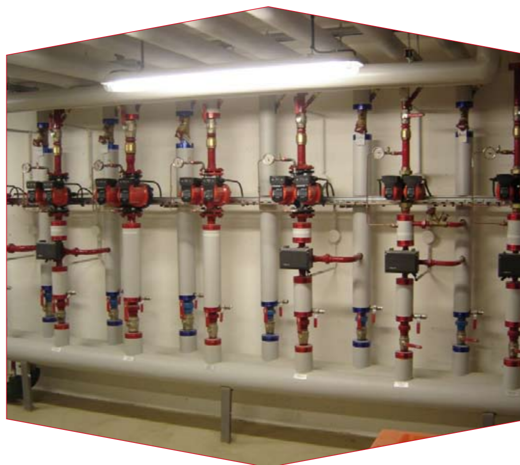
La plomberie, un des thèmes de la formation des Unités Régionales aux métiers du second œuvre dans le bâtiment.

En tous cas, certaines UR déjà formées ont acheté du matériel dédié pour assurer le suivi et la réception des travaux et ont commencé à "goûter" aux vertus de la prestation intégrée dans le bâtiment. Quoi qu'il en soit, le réflexe de proposer une prestation intégrée dans le bâtiment est aujourd'hui bien ancré au sein des staffs dirigeants des UR du LPEE. Désormais, elles proposent pratiquement toutes aux promoteurs un contrat qui couvre toutes les phases de construction de leurs bâtiments. Des études géotechniques aux prestations de second œuvre, en passant par le gros œuvre, le promoteur se retrouve ainsi avec un seul et même laboratoire de contrôle. "Cela soulage beaucoup et rassure énormément