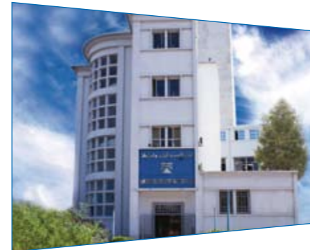
Siège du LPEE à Casablanca.

Le Conseil Intérieur du LPEE a tenu sa deuxième et dernière réunion de l'année, le 28 septembre 2012 au siège du LPEE à Casablanca. A cette occasion, les membres du Conseil ont examiné deux points inscrits à l'ordre du jour, notamment : ▶ un point d'arrêt sur les performances du laboratoire à fin août 2012 ; et ▶ les perspectives pour l'année 2013.