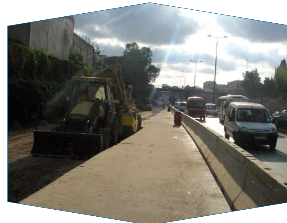
Chantier de l'élargissement de l'Autoroute Urbaine de Casablanca.