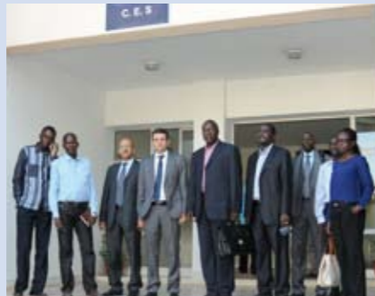
M. le Ministre recevant des explications du D.G du LPEE