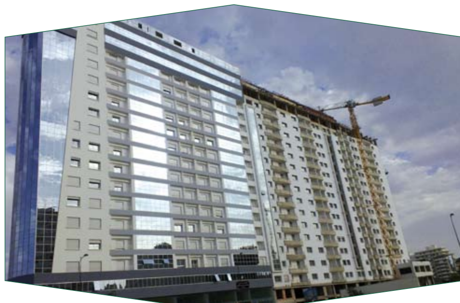
C'est impressionnant, à Tanger les immeubles de 20 étages se comptent par dizaines.

Malgré la crise qui affecte le secteur du bâtiment, la capitale du Détroit offre un cadre idyllique pour développer les prestations de second œuvre. Aussi, l'Unité Régionale du LPEE compte sur cette nouveauté pour assister les maîtres d'ouvrages et la maîtrise d'œuvre dans ce domaine. Elle a déjà acquis du matériel et prépare le grand saut. Les détails.