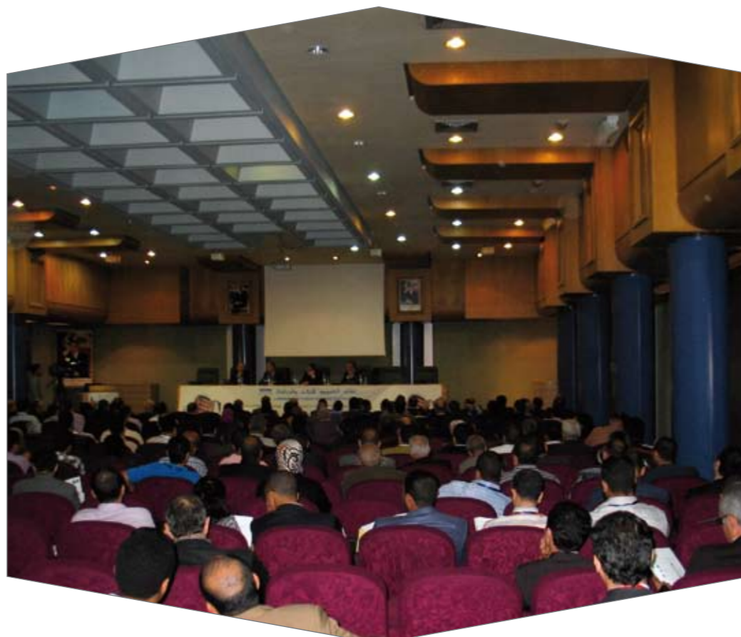
Une vue de la forte assistance lors du séminaire scientifique du LPEE sur le bâtiment en juin dernier.

Pour les mosquées nécessitant l'intervention d'un bureau d'études, l'estimation était fournie forfaitairement et sommairement. Par contre, pour les mosquées classées ou revêtant un caractère historique, des solutions techniques conservatrices et non destructives respectant les techniques et les règles reconnues pour la restauration des monuments ont été proposées ainsi que l'établissement d'une estimation pour la planification des travaux en soulignant le caractère urgent ou non.