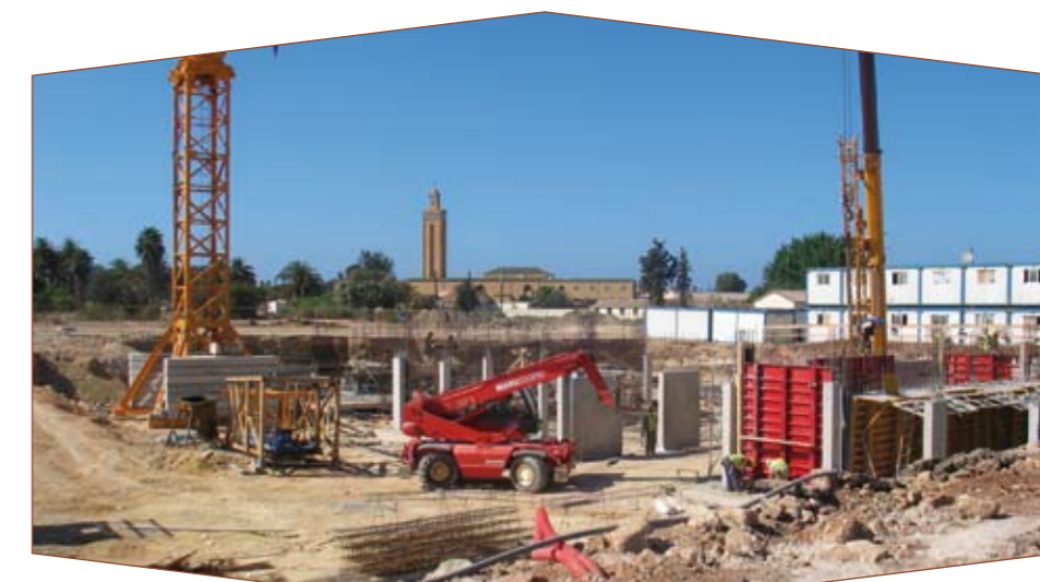
Pose des fondations des immeubles de la CGI.