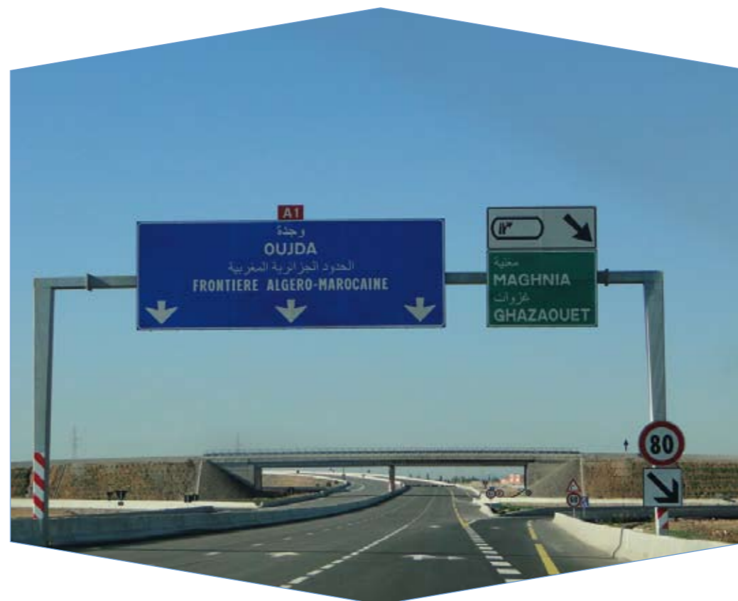
L'autoroute Fès - Oujda.

Les étapes clés du processus comprennent : ▶ l'établissement du contexte de l'EES, ▶ le recueil d'informations de référence, ▶ l'analyse des effets potentiels des propositions et des options alternatives,