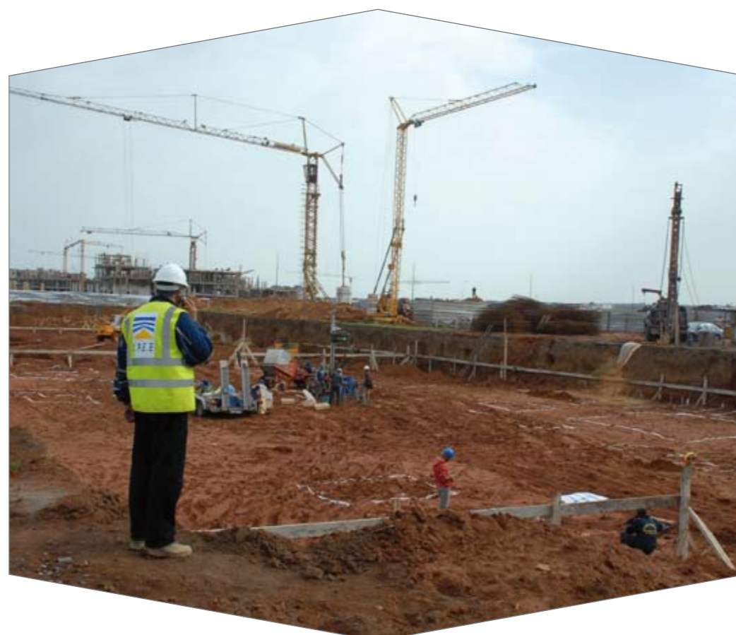
Les études géotechniques sont un passage indispensable pour déterminer la nature des sols.

► la recherche de zones d'emprunt ; ► l'étude de la stabilité géologique des sites ; ► la définition des méthodes de terrassement et de dragage ; ► l'étude de drainage des aires de jeux ; et ► le conseil technique et le suivi géotechnique des travaux (terrassement, stabilité des fouilles, réutilisation des sols...). Le potentiel humain et matériel du CES/LPEE à la pointe de la technologie lui permet d'intervenir simultanément sur pratiquement tout le territoire national.