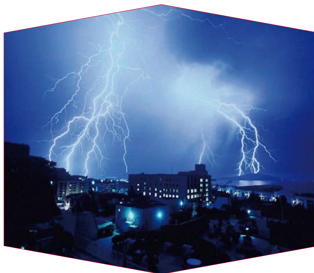
La foudre est un phénomène naturel qui peut avoir des conséquences mortelles.

▶ les effets visuels (Eclairs) dus au mécanisme de l'avalanche de Townsend ▶ les effets électrochimiques qui se traduisent par une décomposition électrolytique par application de la loi de Faraday.