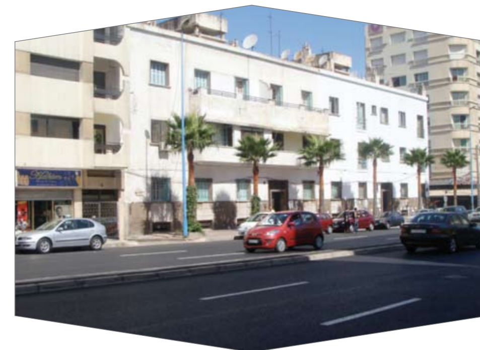
Ici un des bâtiments de Dyar Al Madina diagnostiqué par le CSTC/LPEE.

Rabat, des constructions scolaires et bâtiments publics à Al Hoceima, l'Université Al Akhawayn à Ifrane, les centres hospitaliers provinciaux, les remparts de Fès, Taroudante et Ksar Al Badii, 400 bâtiments à Boujdour et Dakhla, les immeubles de Dyar Al Madina, les mosquées du