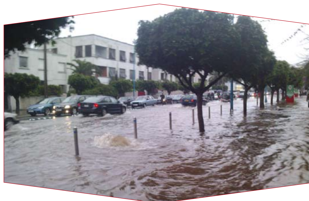
Chaussées inondées par les pluies à Casablanca.

veau des formations rocheuses afin d'avoir une idée sur la perméabilité ainsi que l'état de fissuration de ces formations. Précisons que ce dernier essai permet de se renseigner sur les possibilités de circulation d'eau dans les roches grâce à l'unité Lugeon. Un paramètre qui donne une idée sur la perméabilité des roches rencontrées, qui est une perméabilité de fissures, contrairement à celle des sols qui est une perméabilité d'interstices. Le CES/LPEE a également effectué des essais au laboratoire sur des échantillons