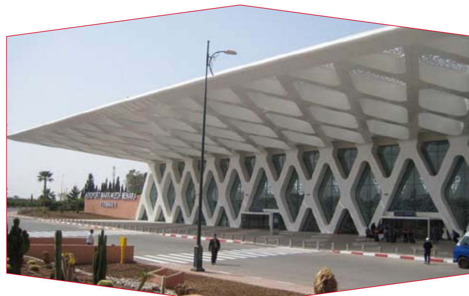
Une vue extérieure de l'aéroport Menara de Marrakech.

▶ diffuser le courant de défaut vers le sol tout en limitant sa propagation horizontale au sol.