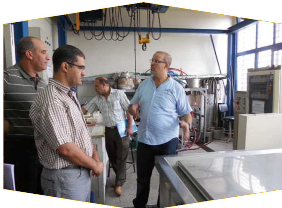
Les auditeurs dans le laboratoire carreaux céramiques.

potentiel pour les matériaux. D'ailleurs, nous comptons accréditer d'autres laboratoires dans les prochains mois", explique le Directeur du CEMGI/LPEE.