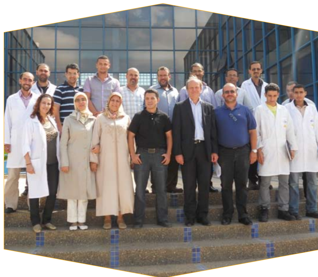
Les équipes des deux laboratoires du CEMGI/LPEE et les auditeurs du Ministère du Commerce, de l'Industrie et des Nouvelles Technologies.