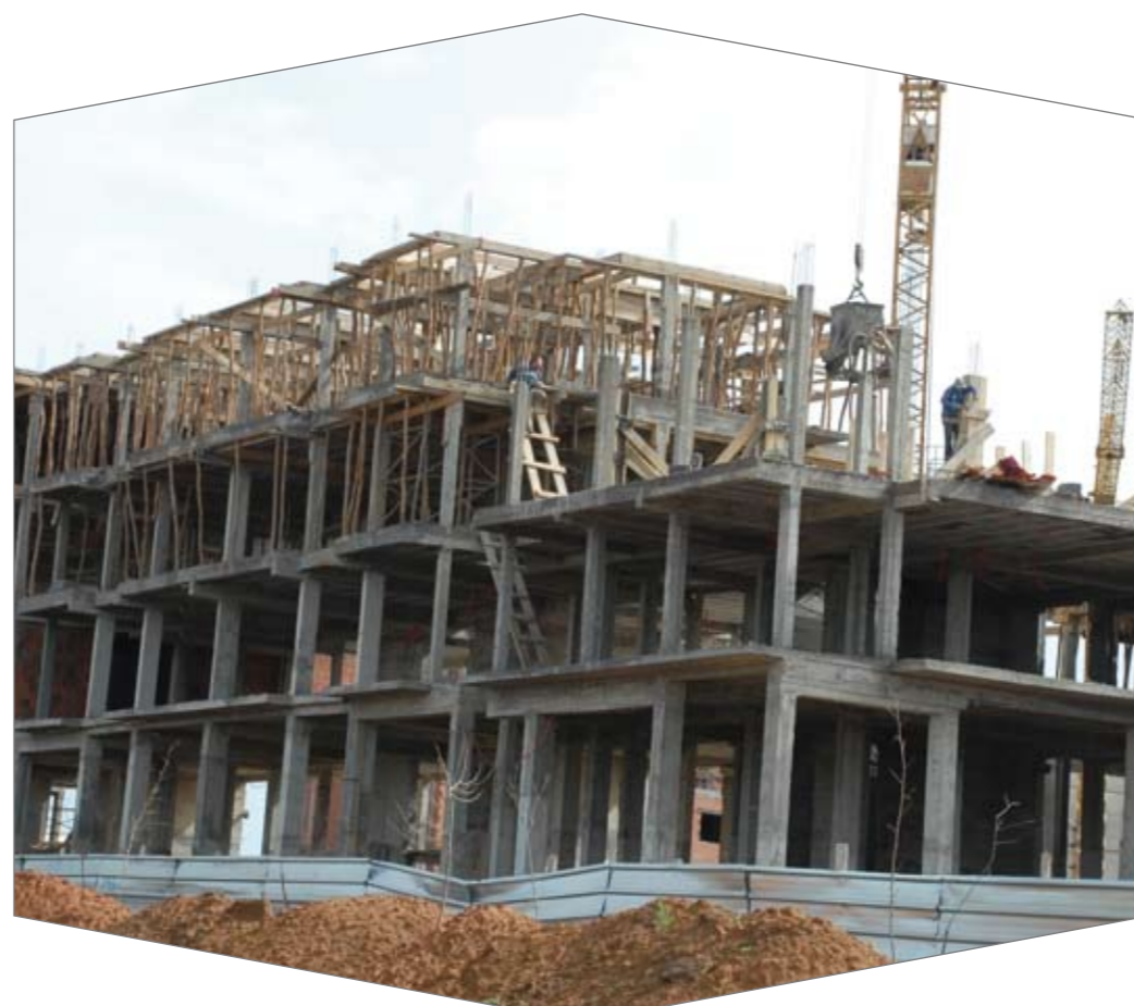
Les fers à béton sont un élément incontournable pour faire tenir debout un bâtiment.