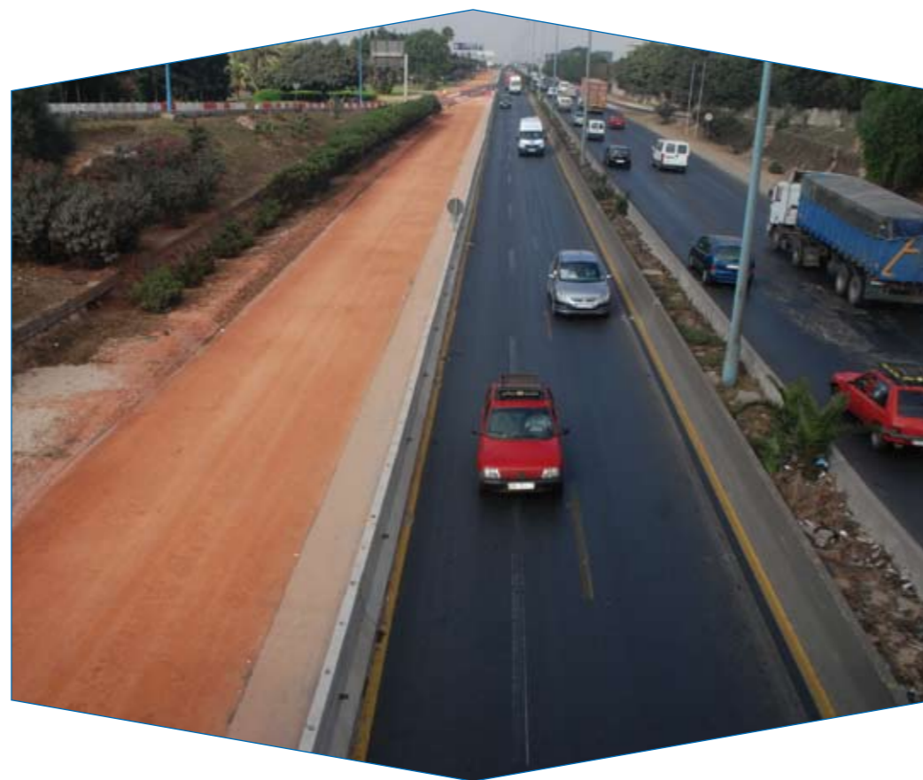
Chantier de l'élargissement de l'Autoroute Urbaine de Casablanca.

Les contraintes qui gênent les travaux sont notamment liées à la circulation, à