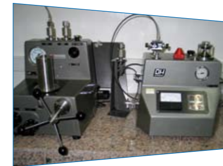
Appareils de mesure de pression.

Suite à sa 3 ème évaluation de surveillance, de contrôle et d'extension réalisée par la DAC (Direction Nationale d'Accréditation) en novembre 2011 et la notification par la Commission d'accréditation en mars dernier de la levée de la suspension d'accréditation ainsi que du maintien d'extension, le LPEE/LNM vient de sortir de l'évaluation de renouvellement pour le cycle 3 où il a été évalué dans le cadre de son accréditation ISO/CEI 17025 version 2005. Globalement, cette évaluation de renouvellement, qui marque le démarrage d'un