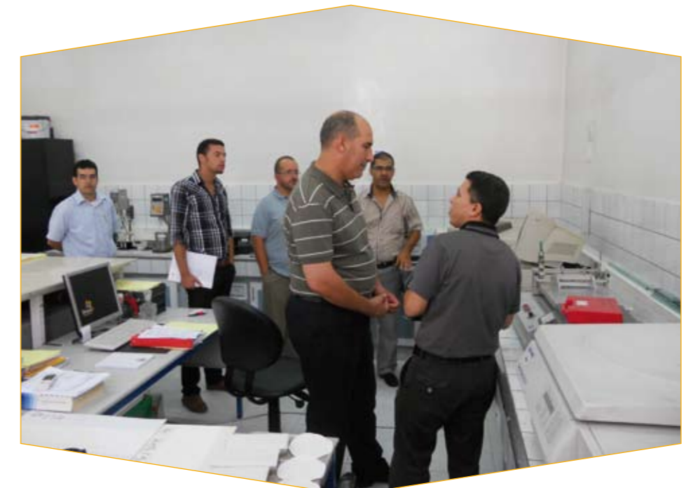
Les auditeurs écoutant les explications dans la salle d'essais de carreaux céramiques.