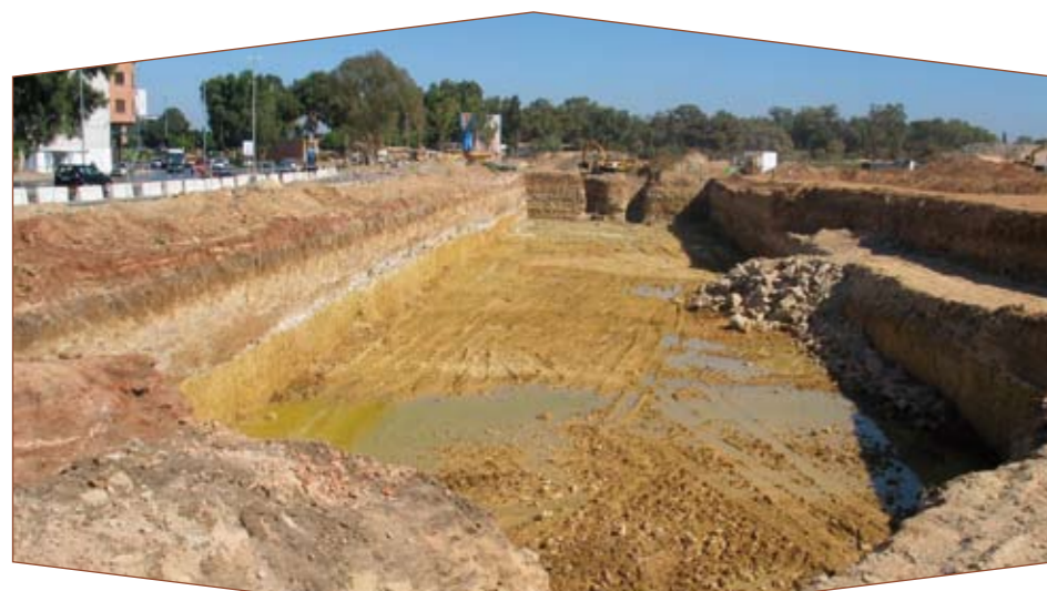
Ici la tranchée où sera érigé le grand bassin de rétention des eaux de pluie.

La filiale de la Caisse de Dépôt et de Gestion, qui est l'un des principaux aménageurs du projet, a effectivement prévu de construire 9 immeubles dans cette première tranche dont une tour de 16 étages. Les travaux ont été confiés à l'entreprise TGCC qui a fait appel au LPEE pour assurer le contrôle externe.